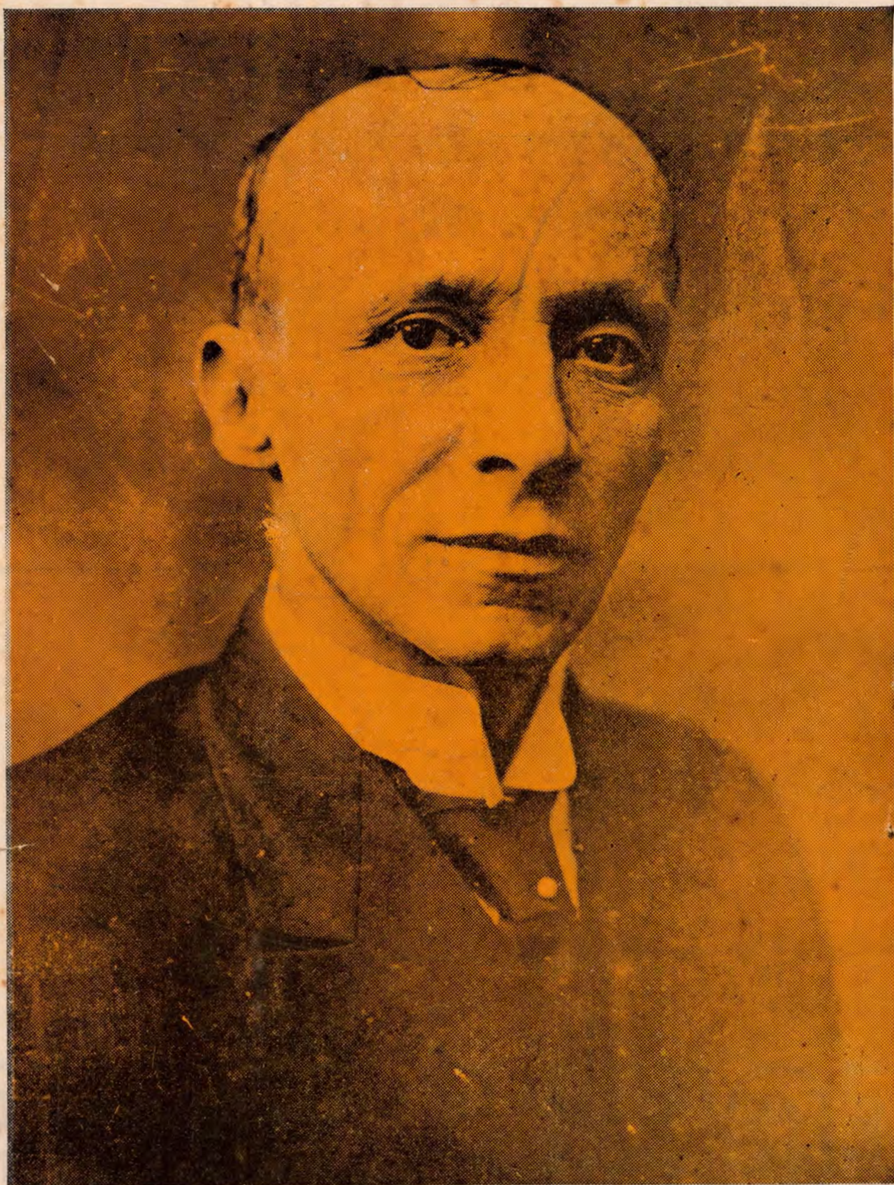
Don Tomás Soley Güell

Proclamado por el Lic. don Ricardo Jiménez O., como Candidato a la Presidencia de la República